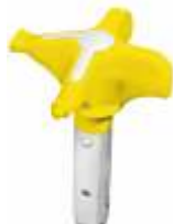
Duză dublă SpeedTip 111-419 / 115 / 421 210-512 / 235-527 243-539 COD: WA271XXX