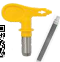
Duză TradeTip 3 Filtru inclus Diverse dimensiuni COD: WA553XXX