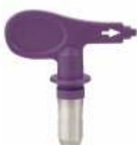
Duză TradeTip 3 FineFinish 410/414/510/512