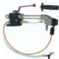
Lance aplicare in-wall pneumatică COD: WA2334122

Cot reglabil 360(int/ext 1/4"), COD: WA2454974 94,9 € Conector reglabil 360(int/ext 1/4"), COD: WA2454968 26,5 € Conector reglabil 360(int/ext 3/8"), COD: WA2454969 26,5 €