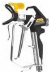
Pistol Vector Grip