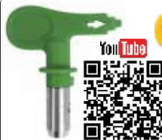
Duză HEA ProTip 415/417/512/519/521 COD: WA554XXX