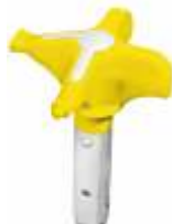
Duză dublă SpeedTip 111-419 / 115 / 421 210-512 / 235-527 243-539 COD: WA271XXX