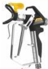
Pistol Vector Grip COD: 24964240555