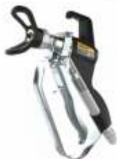
Pistol AG19 COD: 4004025077050