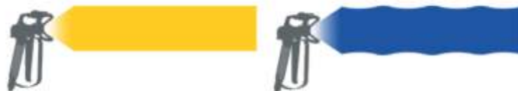
Fig.: La presiune scăzută: